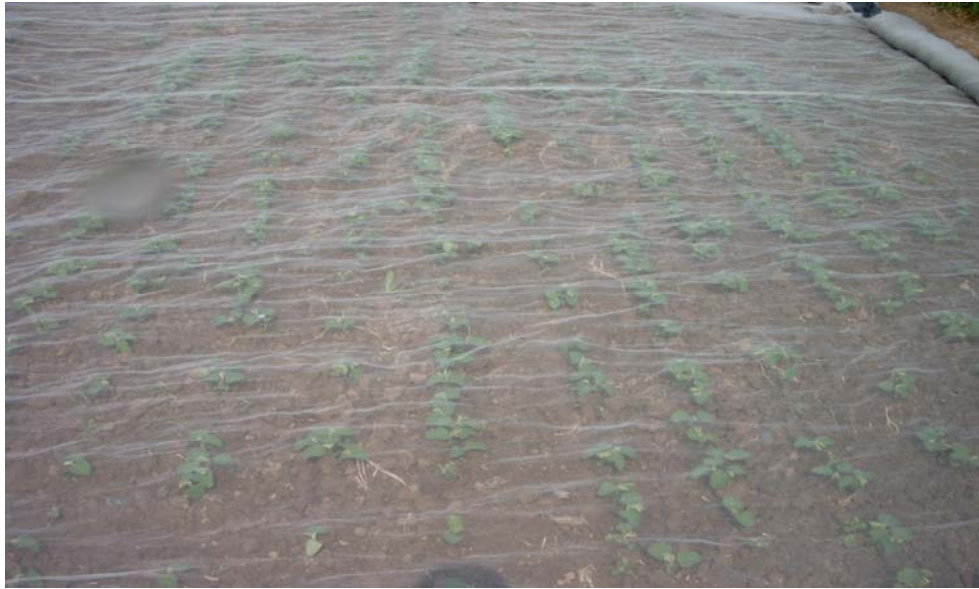
Foto 2. Proefveld afgedekt met acryl doek.