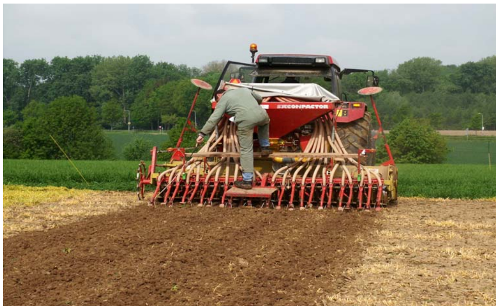
Foto 1. Zaaien van de soja met een pneumatische zaaimachine.