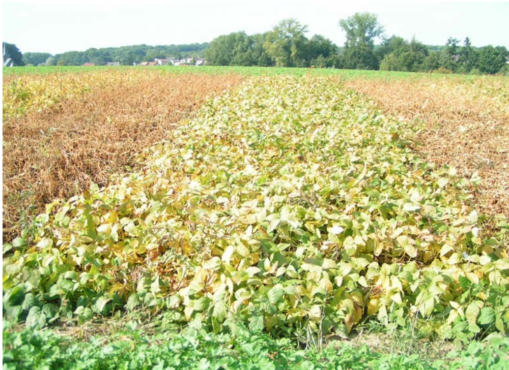
Foto 3. Verschil in afrijping tussen de rassen begin september.