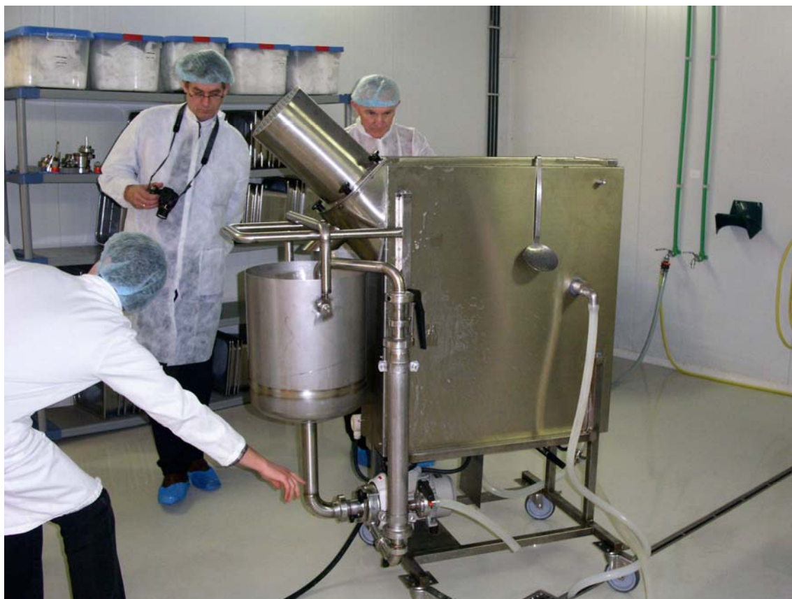
Foto 4. Sojamelkmachine voor het maken van een sojadrink.

In deze machine worden de sojabonen ingeweekt in water en later in een continu proces geschuurd. Dit gebeurt onder water zodat de sojadeeltjes oplossen in het water. Op deze wijze ontstaat er een emulsie van fijne sojadeeltjes in water. Deze sojadrink is uitermate geschikt voor mensen met een koemelkallergie.