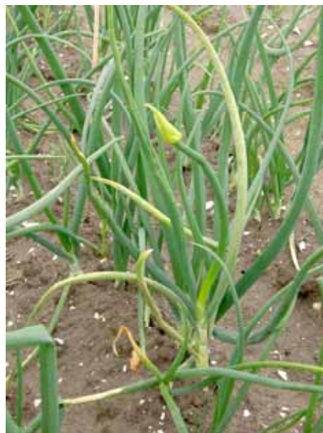
Figuur 1. Systemisch aangetaste uienplant.

Uit Pools veldonderzoek van 1 e -jaars plantuien blijkt dat bij een zware massale aantasting en daarna snelle afsterving (binnen 2 weken) van het aangetaste loof het aantal systemisch aangetaste planten na uitplanten het jaar daarop 0,07% is. Bij lichtere aantasting en daarna minder snel afsterven (4 weken) van het aangetaste loof levert 0,7% systemisch aangetaste planten op. Men heeft verder uit observaties geconcludeerd dat als in een partij 2 e -jaars plantuien 1% van deze uitjes systemisch geïnfecteerd is, er bij de teelt op het veld bij gunstige omstandigheden een snelle uitbreiding van valse meeldauw aantasting in het perceel plaatsvindt.