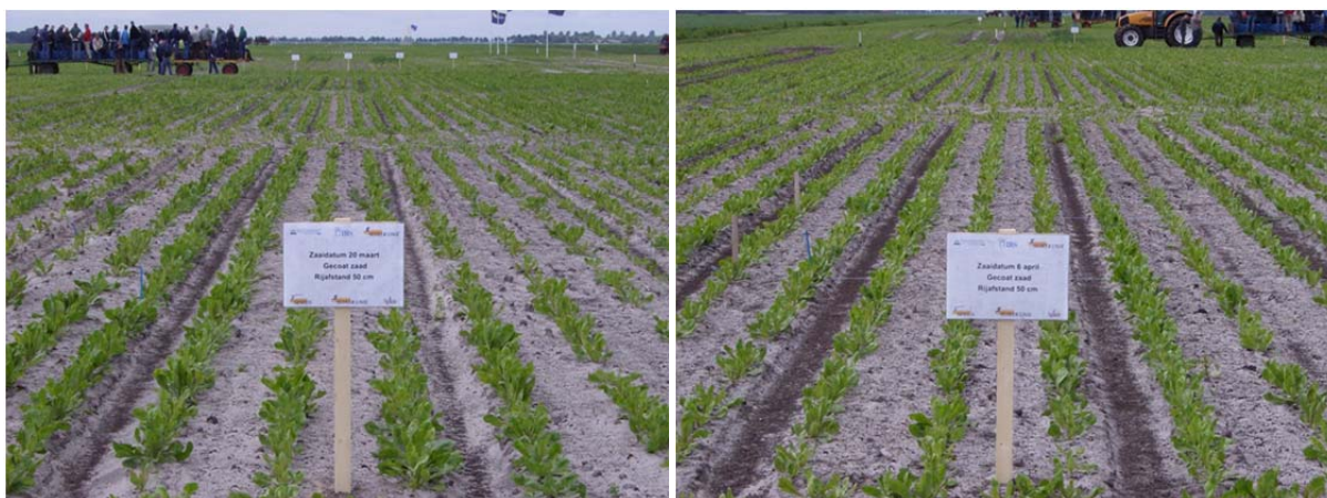
Afbeelding 1 en 2. Gewasontwikkeling op 4 juni 2009 in Valthermond. Links: zaaitijdstip 20 maart, rechts: zaaitijdstip 6 april.

In 2010, leidde vroeg zaaien, zowel in Valthermond als in Colijnsplaat tot een behoorlijke verhoging van het percentage schieters. Het voorjaar van 2010 was ook duidelijk kouder dan van 2009 en 2011 (zie figuur 1). Met name de eerste twee decades van mei waren relatief koud.