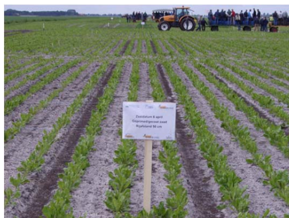
Afbeelding 3 en 4. Gewasontwikkeling op 4 juni 2009 in Valthermond, zaaitijdstip 8 april. Links: ongeprimed zaad, rechts: geprimed zaad.

Na opkomst is er in de proeven teruggedund tot op de beoogde plantaantallen van 16 of 20 planten per m 2 . Hierdoor heeft het effect van plantaantal niet door kunnen werken in de vroegheid grondbedekking en de opbrengst. Desondanks gaf geprimed zaad meestal een iets snellere grondbedekking dan ongeprimed zaad. Indien het A-en het B-geprimede zaad buiten beschouwing gelaten wordt, dan gaf geprimed zaad gemiddeld over alle jaren 1,9% meer opbrengst dan ongeprimed zaad. Uit PAGV-onderzoek uitgevoerd in