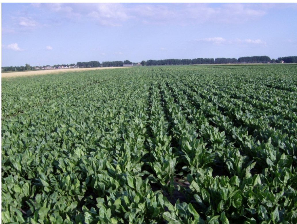
Afbeelding 5. Gewasontwikkeling Valthermond in juli 2009. Links: 37,5 cm rijafstand, rechts: 50 cm rijafstand.