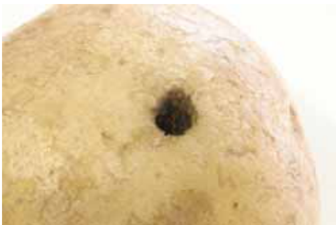
Vreterij in aardappelknol (cv. Lady Christl). Ritnaald of Rhizoctonia kan veroorzaker zijn.