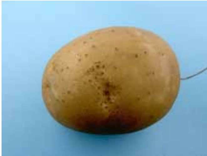
Figuur 4: Rhizoctonia solani knolaantasting, aantasting lijkt het begin van een gaatje te kunnen zijn (cv. Santé)