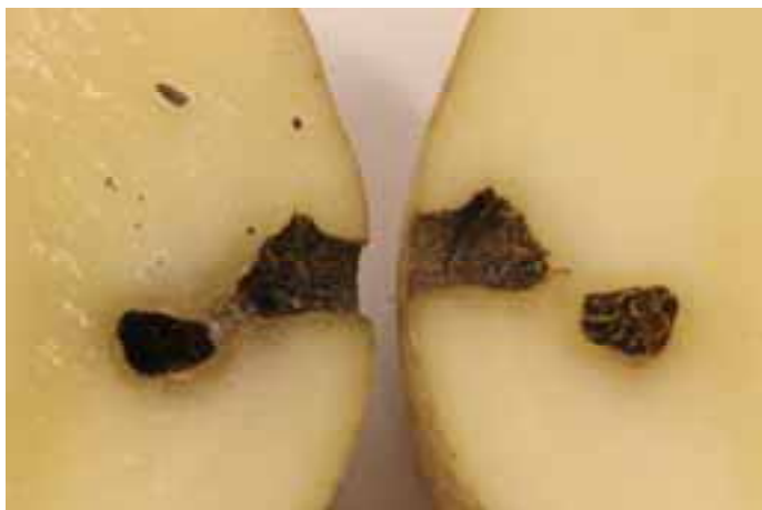
Vreterij in aardappelknol (cv. Lady Christl). Ritnaald is de waarschijnlijke veroorzaker.