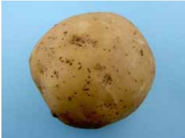
Figuur 1: Rhizoctonia solani knolsymptomen: lakschurft en knolweefselaantastingen (cv. Santé)