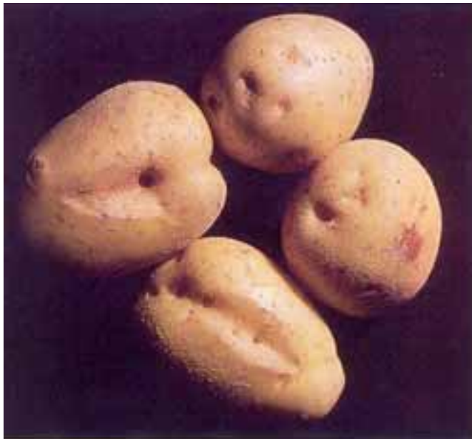
Figuur 5: Groeischeuren en gaatjes veroorzaakt door Rhizoctonia solani op aardappelknollen