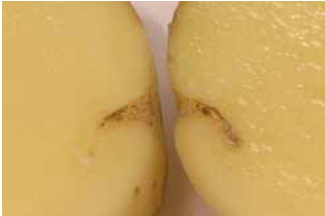
Doorgesneden knol (cv. Fontana). Ritnaald is de waarschijnlijke veroorzaker.