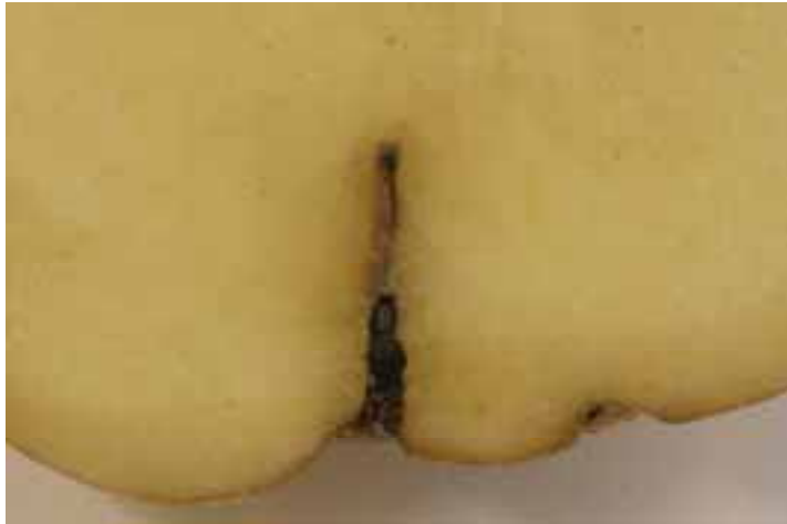
Gaatje in aardappelknol (cv. Lady Christl). Ritnaald is de waarschijnlijke veroorzaker.