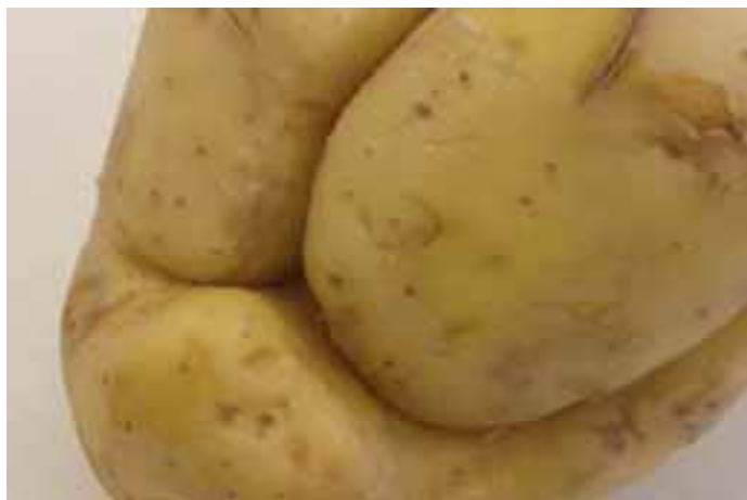
Rhizoctonia groeischeur type aantasting in cv. Agria

De aardappelknollen in de afbeeldingen zijn geteeld in 2006.