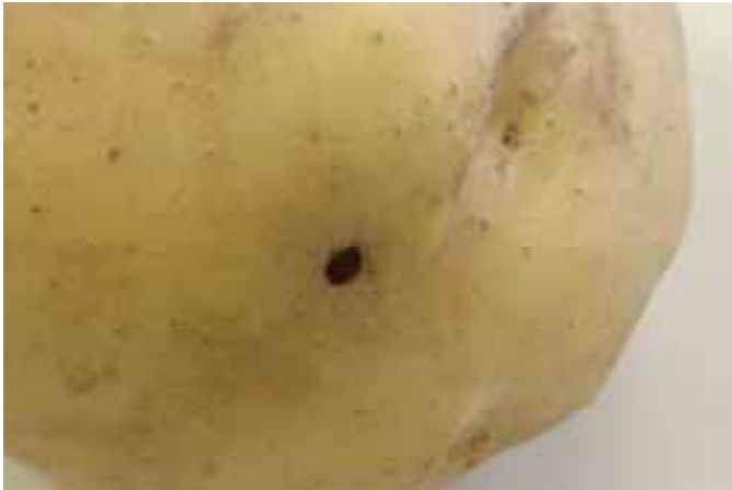
Gatje in aardappelknol (cv. Fontana). Veroorzaker kan Ritnaald of Rhizoctonia zijn.