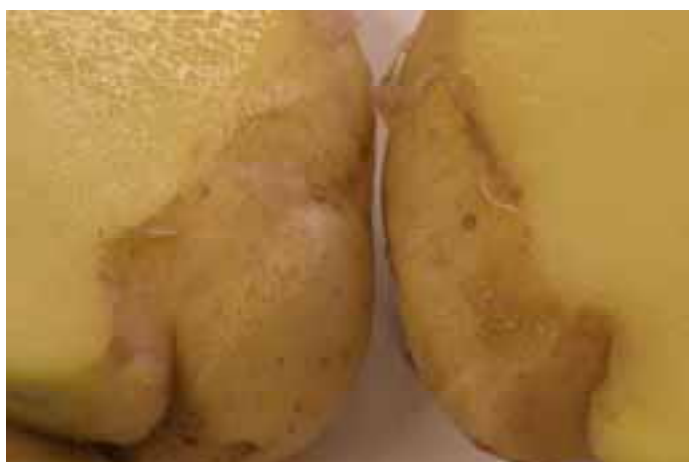
Doorgesneden knol met Rhizoctonia groeischeur type aantasting in cv. Agria