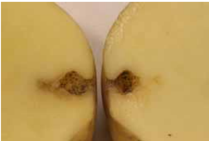
Doorgesneden knol (cv. Fontana). Ritnaald is de waarschijnlijke veroorzaker.