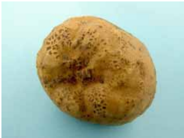
Figuur 2: Rhizoctonia solani knolsymptoom: misvormingen (cv. Santé)