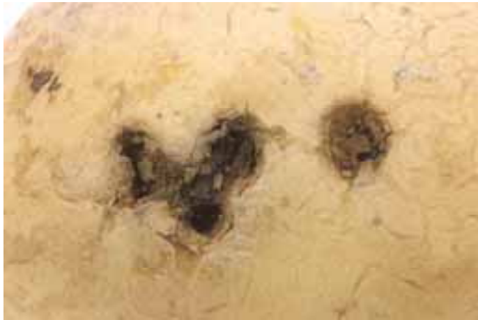
Vreterij in aardappelknol (cv. Lady Christl). Slakken zijn de waarschijnlijke veroorzakers.