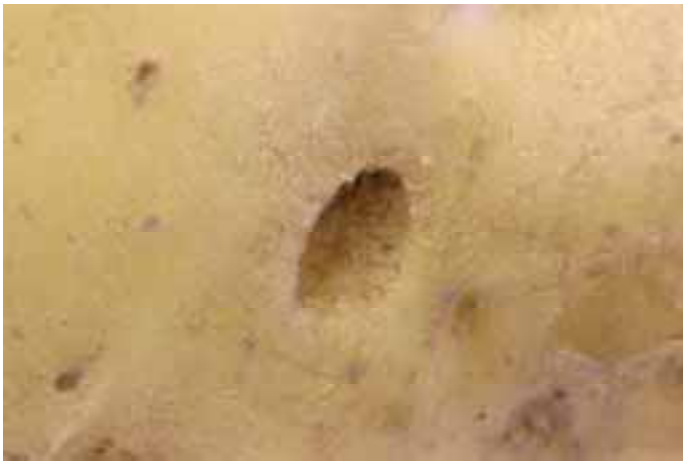
Gatje in aardappelknol (cv. Fontana). Rhizoctonia is de waarschijnlijke veroorzaker.