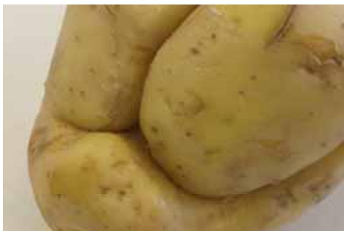
Rhizoctonia groeischeur type aantasting in cv. Agria