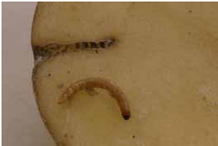
Gaatje in aardappelknol (cv. onbekend). Ritnaald is de waarschijnlijke veroorzaker. De ritnaald is ter illustratie op de knoldoorsnede geplaatst. De doorsnede van de ritnaald komt overeen met de doorsnede van het gaatje.