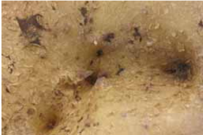
Op gaatje lijkend symptoom op aardappelknol (cv. Lady Christl). Rhizoctonia is waarschijnlijke veroorzaker.