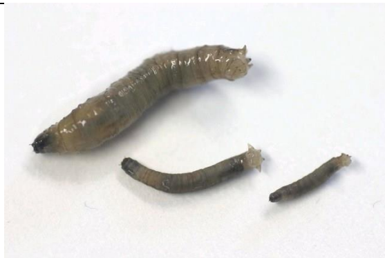
Diverse stadia (leeftijden) van emelten (tot 3 cm).

Emelten zijn tot 3 cm lange, ronde, grijze, zachte larven van langpootmuggen. Ze kunnen door vraat aan wortels en ondergrondse stengeldelen schade doen in allerlei gewassen. Schade ontstaat vooral in het voorjaar en bij kiemplanten of jong pootgoed (bijv. koolplanten). Emelten komen vooral voor na gescheurd grasland. De volwassen langpootmuggen doen geen schade.