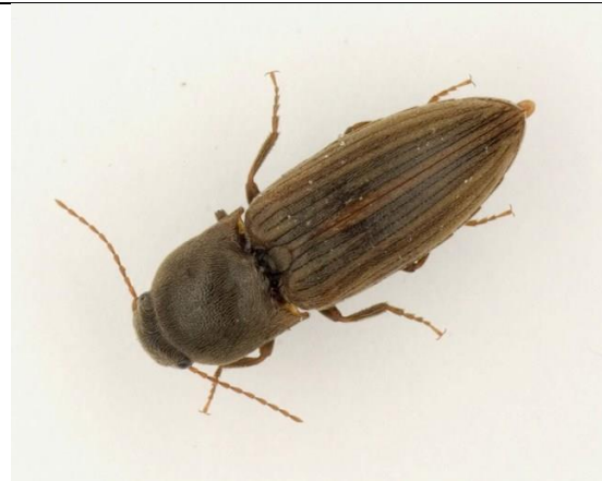
Een volwassen kniptor (ongeveer 2 cm lang)