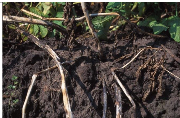
Afgestorven aardappelplanten door Verticillium.

Slaapziekte of Verticillium-verwelkingsziekte (veroorzaakt door Verticillium albo-atrum en Verticillium dahliae ) is een schimmelziekte die bij diverse glasgroenten schade kan veroorzaken. De symptomen zijn verwelking en vergeling van het gehele blad en de hele plant. Dit is in tegenstelling met een aantasting door Fusarium. De vaatbundels van aangetaste planten zijn bruin verkleurd. Een besmetting met Verticillium kan in de vorm van rustmycelium jarenlang overleven, ook bij teeltwisselingen.