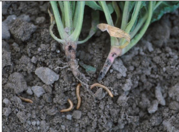
Bietenplanten met aangevreten wortels en ritnaalden

Ze vreten aan de wortels van planten, die vaak verkleuren naar geel of rood en tenslotte afsterven. Aangetaste planten kun je gemakkelijk uit de grond te trekken. Ritnaalden kunnen wel 5 jaar oud worden. Ze kunnen in grote getalen voorkomen in oud grasland. Vaak ontstaat in het vervolggewas, in het 2 e jaar na scheuren, grote schade.