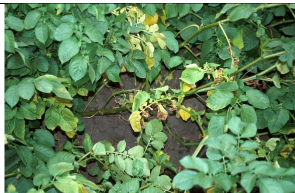
Verwelkingsziekte door Verticillium in aardappel.