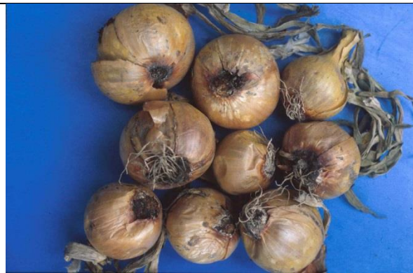
Uien met aantasting van de wortels door Fusarium.

In percelen kunnen soms hele valplekken ontstaan, maar niet altijd is duidelijk of Fusarium dan ook de veroorzaker is. Naast bijv. droogrot in aardappelknollen zijn verschillende kasgroenten gevoelig voor verwelkingsziekten door Fusarium, herkenbaar aan vergeling en afsterven van bladeren.