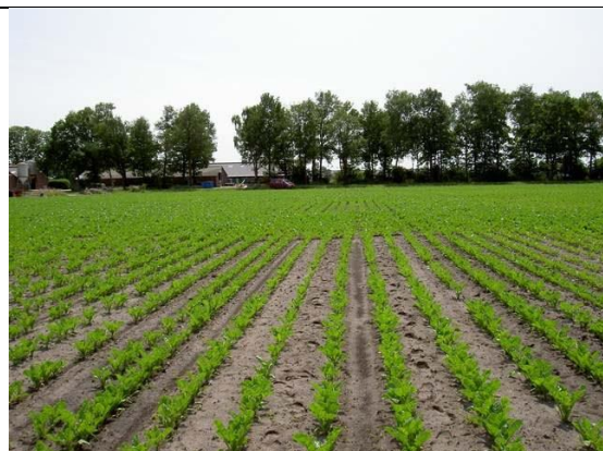
Bieten aantasting door Rhizoctonia, vooraan een vatbaar ras, achteraan beschermde planten

Veel bodemziekten- en plagen zijn te herkennen aan achterblijvende groei of het wegvallen van (jonge) planten, soms van hele plekken in een rij of perceel. De oorzaak is lang niet altijd meteen duidelijk. Dat kan door een schimmel of een aaltjessoort worden veroorzaakt, of door insectenlarven of een probleem met de bodemstructuur (bijv. water dat is blijven staan). Zoek tijdig advies van een deskundige om de oorzaak te achterhalen. Verkleuringen van knollen, wortels en de wortelhals wijzen vaak op schimmelziekten. Weggevreten wortels worden door insectenlarven veroorzaakt, vaak zijn die met enig zoeken nog wel in de kluit rondom de wortels te vinden. Aaltjesproblemen zijn alleen goed vast te stellen door bodemonsters te laten onderzoeken, om de juiste soort en bijbehorende strategie te kunnen bepalen.