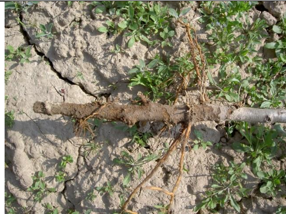
Een jonge appelboom waarvan de wortels en onderste schors zijn weggevretten.

Op een herkenningkaart als deze is niet genoeg ruimte om in te gaan op specifieke ziekten en plagen voor verschillende gewassen. Naast allerlei teelthandleidingen (zie www.kennisakker.nl ) en veldgidsjes voor diverse gewassen is ook de 'Beeldenbank ziekten en plagen' van Groen kennisnet ( http://databank.groenkennisnet.nl/index.htm ) een goede plek voor meer informatie.