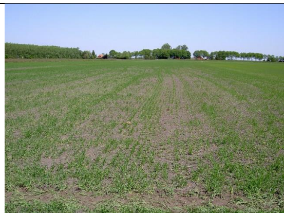
Afgestorven gerst door ritnaalden