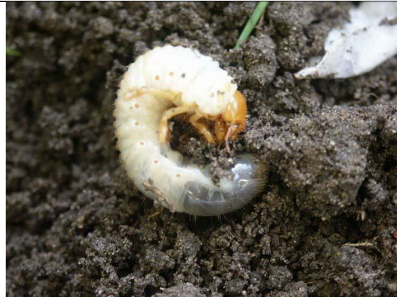
Een volgroeide engerting van een meikever.

De larven vreten aan dunne wortels en ontschorsen dikke wortels. Planten komen los te liggen en verdrogen. Als engertingen in grote aantallen voorkomen kan aanzienlijke schade ontstaan, van losse zoden van grasvelden tot het afsterven van jonge boompjes. Vooral in het oosten van het land wordt regelmatig schade van engertingen gemeld. Kraaien en roeken, die engertingen proberen te vangen, kunnen de zode van hele sportvelden lostrekken om een lekker hapje te bemachtigen. De meikevers vreten aan bladeren om hun eieren te laten rijpen.