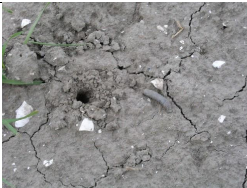
Een emelt (rechts) naast een plantgat