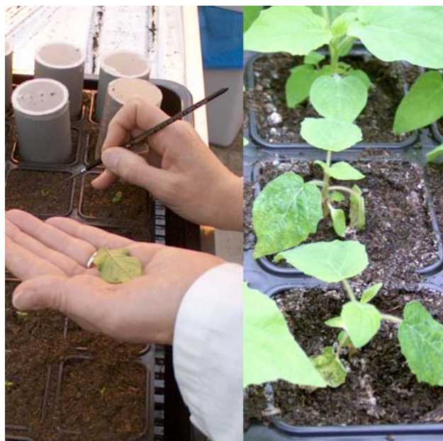
Figuur 3: Overdrachtsexperimenten met bladluizen. Links: individuele bladluizen worden op de Physalis floridana zaailingen gezet en de planten worden afgedekt met een kooitje. Rechts: na drie weken zijn de symptomen duidelijk zichtbaar en kan de overdrachtsefficiëntie worden bepaald.