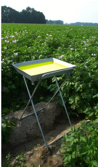
Figuur 1: A) Gele vangbak

Omdat het ondoenlijk was om alle gevangen bladluizen te determineren is ervoor gekozen om tijdens de vangstperiode (in 2006 en 2007: 1 mei tot 1 augustus en in 2008: 1 april – 1 augustus) de vangsten van 1 dag per week te analyseren. Daarnaast werden ook de afklopvangsten die vroeg in het seizoen worden uitgevoerd geanalyseerd.