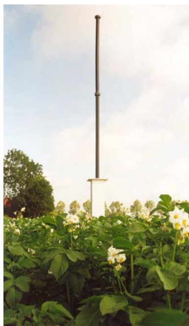
B) Hoge Zuigval