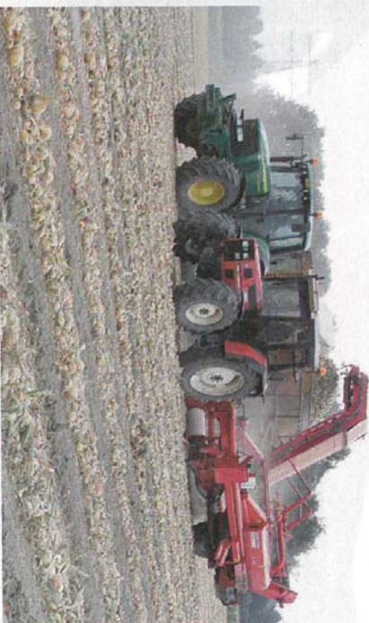
Niet alleen de kilo-opbrengst, maar ook de kwaliteit van het eindproduct weegt mee bij het kiezen van een uienras.

met ongeveer 143.000 ton. Ook Groot-Brittannië (121.000 ton) en Iwoorkust (77.000 ton) zijn goede klanten. In Nederland zijn ongeveer 2800 bedrijven die elk tenminste 2 hectare zaauien telen. Het totale areaal zaauien bedraagt dit jaar volgens het Centraal Bureau voor de Statistiek bijna 22.000 hectare. Dat is 4 procent meer dan vorig jaar.