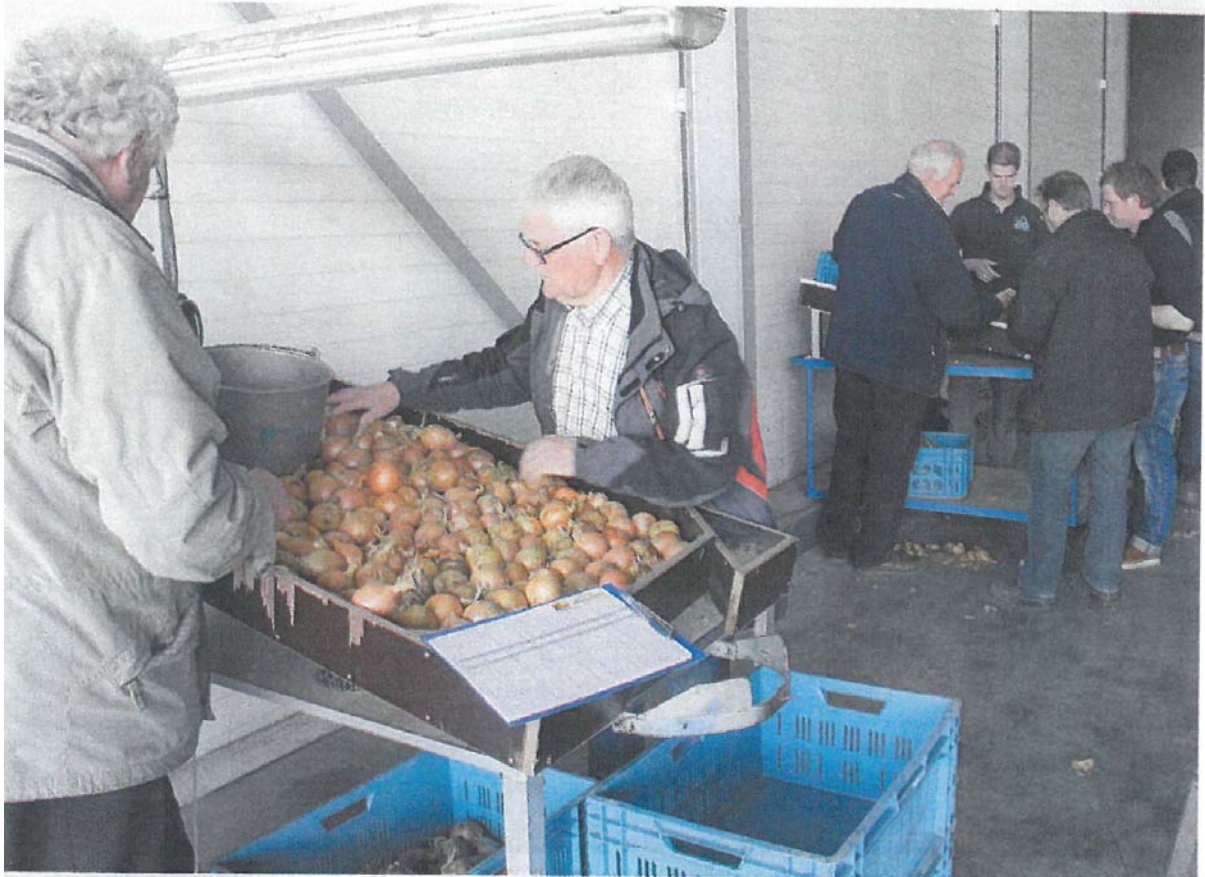
eskundigen beoordelen volgens een protocol de uienrassen.