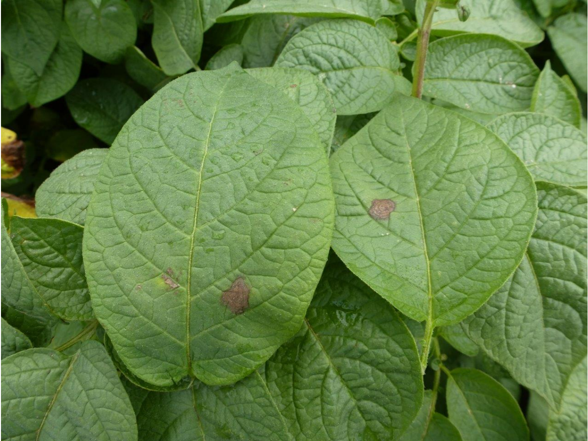
Figuur 4 Typische A. solani vlekken in dit geval in het ras Bintje.