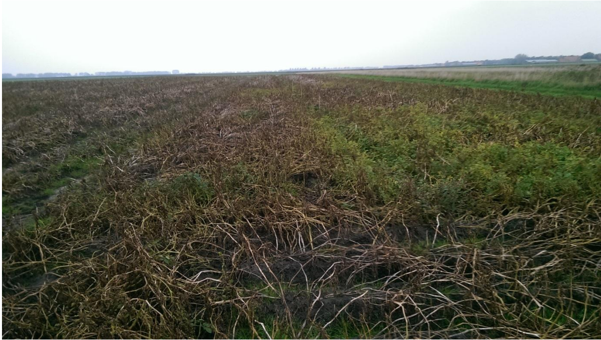
Figuur 3. Proefveld, foto genomen op 24 september; het eerste veld rechts is object D (Curzate M) en het derde veld links is object M (Unikat Pro + specifieke Alternaria bestrijding).