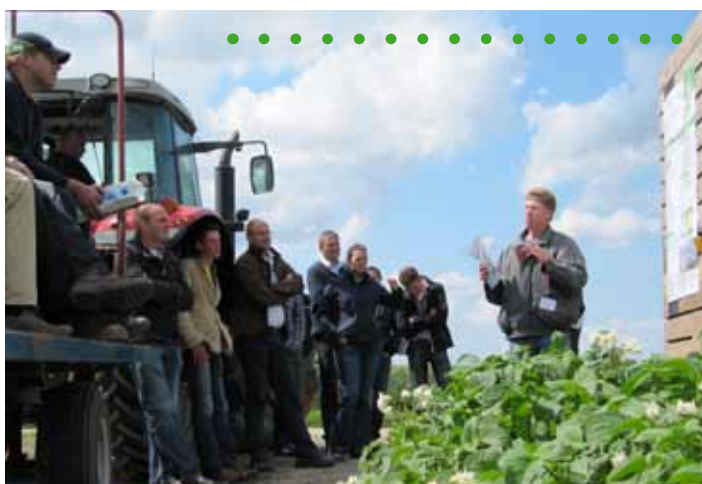
Open dag Kollumerwaard Open dagen geven de gelegenheid de proeven te bezoeken