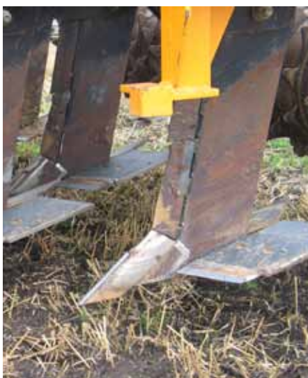
Woelpoot met vleugelscharen

Ten tweede is het van belang om te weten bij welk vochtgehalte u de grond het beste los kunt maken. Woelen werkt het beste in drogere grond, bijvoorbeeld na de oogst van een graangewas. Om te voorkomen dat een opgebroken bodem zich weer in de oorspronkelijke toestand zet en dan nog dichter wordt, is het zaaien van een groenbemester erg nuttig. De groenbemester wortelt in de breukvlakken van de opgebroken grond zodat de bodem zich niet zo snel opnieuw zet. Voor het opheffen van een verdichting zijn verschillende