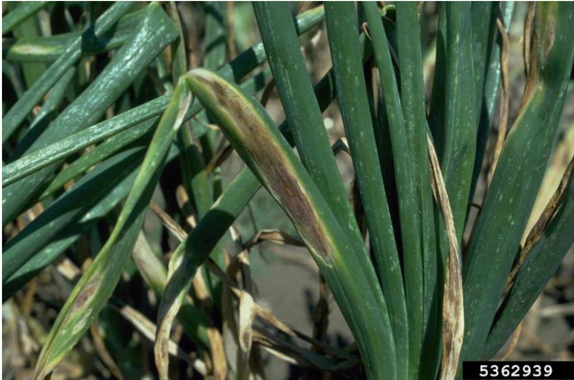
A. porri op ui