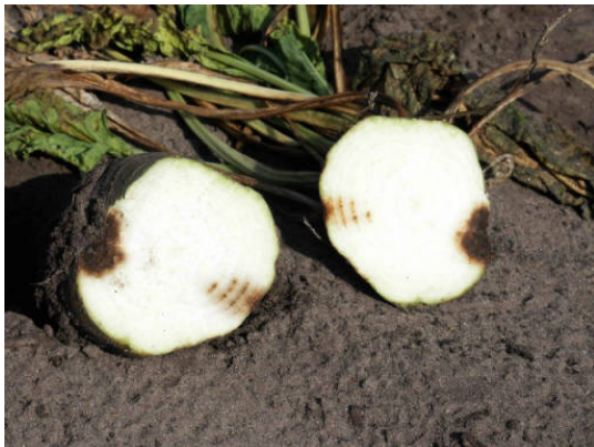
Doorgesneden biet met verrotting als gevolg van Rhizoctonia solani .