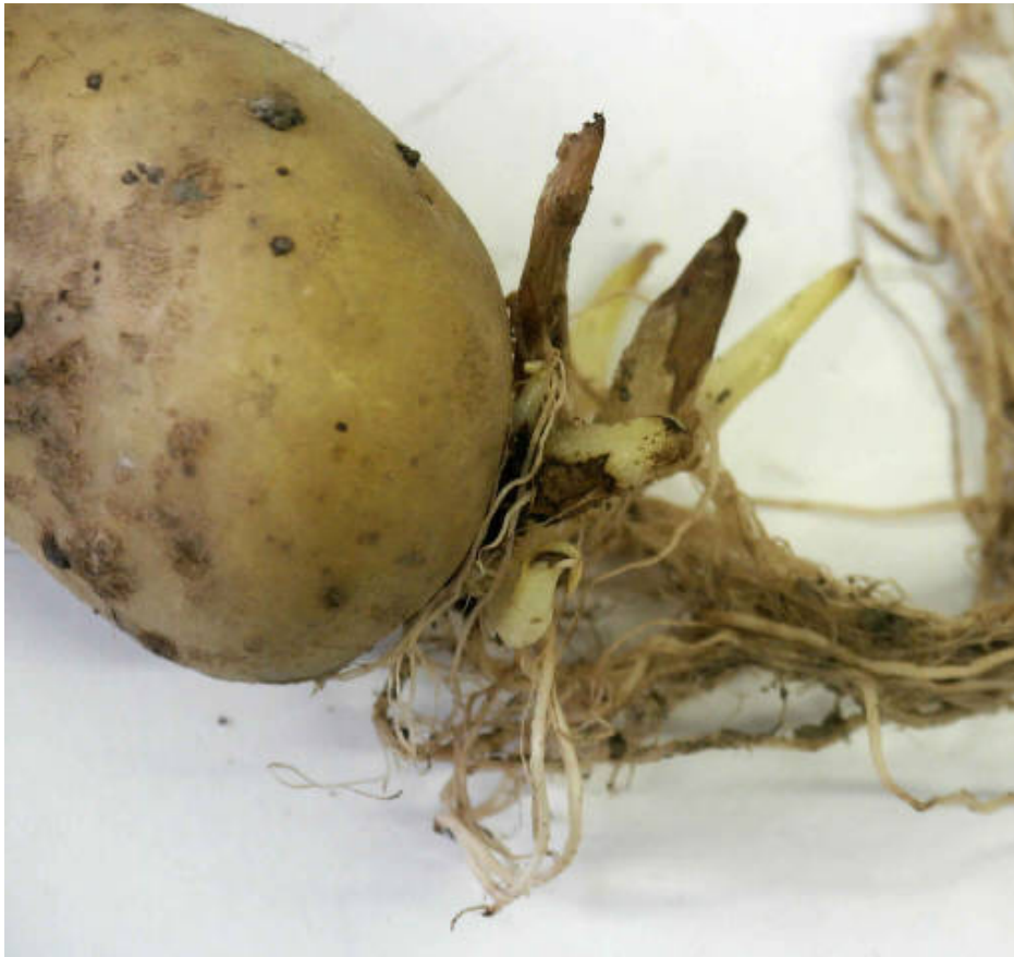
Lakschurft op de knol en afgestorven stengels met lesies van Rhizoctonia .

worden deze AG groepen niet verder behandeld.