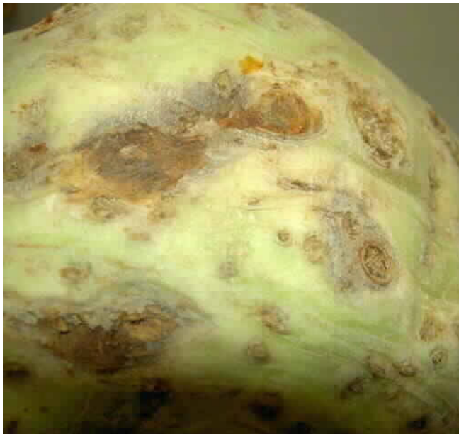
Chocolade en schurftachtige rotte plekken op knolselderij veroorzaakt door P. apiicola .

Selderij, waaronder haar verschillende vormen snij-, bleek en knolselderij, en andere schermbloemigen als koriander zijn de waardplanten van P. apiicola [6,7,8]. Selderij, knolselderij, wordt specifiek in verband gebracht met economische schade [4]. Deze phoma-variant tast ook peen en peterselie aan. Er is twijfel of er ook andere gewassen geïnfecteerd kunnen worden. Er zijn onderzoeken waaruit blijkt dat dille, venkel, koriander, karwij, wortel en pastinaak geïnoculeerd zijn, maar dat er geen infectie op trad. Pastinaak is wel vatbaar. Peterselie is even vatbaar als knolselderij. Karwij is zeer weinig vatbaar, terwijl de gevlekte scheerling en dille niet vatbaar zijn [3].