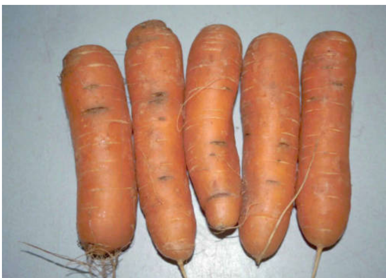
Cavity spot op peen.

P. sulcatum is geïsoleerd van peen en andere Apiacae, zoals peterselie en spinazie. Verder is P. sulcatum teruggevonden op bonen, aubergine, watermeloen, ui en peper [2]. De waardplantgeschiktheid in de kas was heel goed voor peen, selderij, peterselie en pastinaak, er was weinig wortelaantasting op sla, komkommer en meloen en geen wortelaantasting op ui, witte kool, mais en tomaat [3]. In Australië werd P. sulcatum gevonden op peterselie, pastinaak en selderij, werd een te verwaarlozen aantasting van boon en spinazie vastgesteld, terwijl suikerbiet, mais, broccoli, tomaat, komkommer, watermeloen, peper, sla, ui, gerst, haver, rogge en tarwe niet werden aangetast [4]. Na de gewassen tarwe, aardappelen, suikerbiet en katoen was er geen verschil in cavity spotaantasting [2] [5]. Dit geeft aan dat de vermeerdering op deze gewassen niet hoog is en niet van elkaar verschilt.