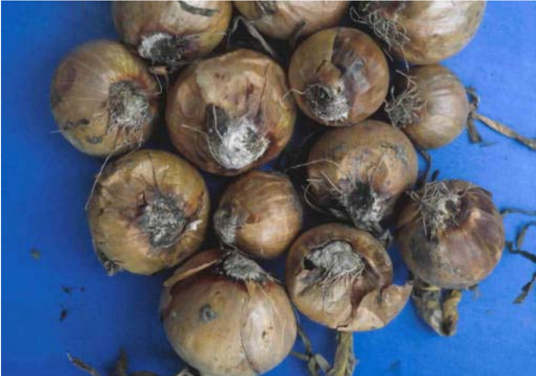
Aangetaste bolbodems van ui door Foc.