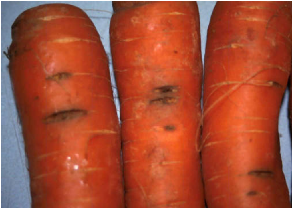
Cavity spot op peen.

In Nederland was de aantasting van peen na uien en ook in geringe mate na witlof lager dan na peen, aardappelen, suikerbieten of spruiten en na gras hoger [4].