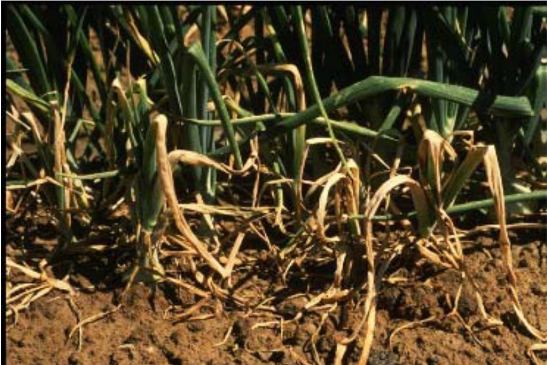
Door Foc aangetaste planten.