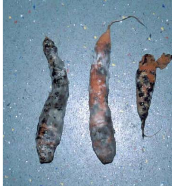
Door Sclerotinia aangetaste penen.