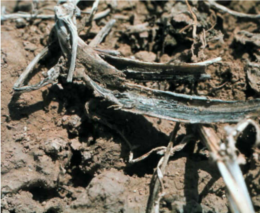
Miljoenen microsclerotien van Verticillium dahliae op en in de stengels van aardappelen.

worden tegengegaan door de populaties van alle plantpathogene aaltjes tegen te gaan. Schade door Verticillium kan worden voorkomen door de opbouw van de populatie tegen te gaan. Dit kan door de vorming van microsclerotien te voorkomen en door de microsclerotien in de grond versnelt te laten sterven. De vorming wordt tegengegaan door de teelt van niet of weinig vermeerderende waardplanten en door een vroege oogst van een groen gewas (conserven erwten, -tunboon, pootaardappel) of door een grondige afvoer van gewasrestanten (vezelvlas). Loof trekken geeft ook minder vorming van microsclerotien, maar loof trekken of afvoer van gewasresten gaf niet een lagere besmetting die tot een hogere opbrengst leidden [11]. Na de vorming van de microsclerotien zijn deze in de grond te bestrijden door middel van biologische grondontsmetting [12].