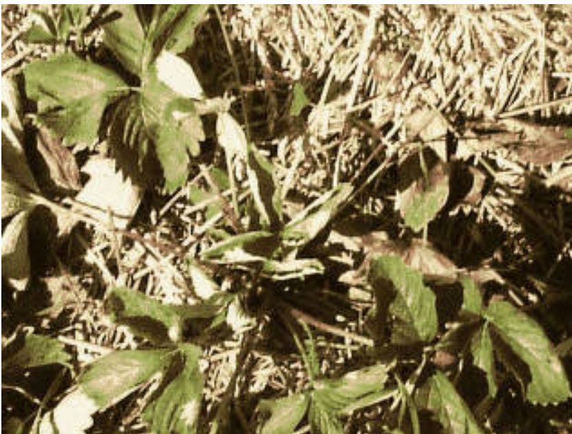
Door Verticillium aangetaste aardbeiplant.