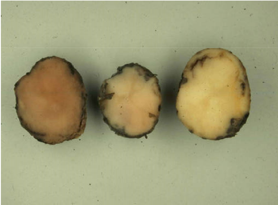
Verkleuring van de knollen na 0, 20 en 60 minuten na doorsnijden.