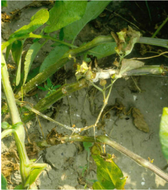
Sclerotinia sclerotiorum op aardappelstengels.