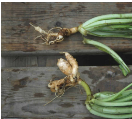
Knolvoet op een Aziatisch koolgewas Komatsuna ( Brassica campestris rapifera ).

Knolvoet tast alleen kruisbloemigen aan, waaronder bekende landbouwgewassen als Brassica oleracea (kool), B. napus (koolzaad) en B. rapa (raapzaad). Deze soorten zijn verder onderverdeeld in varianten, zoals (bij kool) bloemkool, boerenkool en spruitkool. Per variant zijn commerciële rassen (cultivars) verkrijgbaar, waarvan rassen voorkomen met hoge en lage resistentie tegen knolvoet. Rasresistentie is de hoeksteen voor management van knolvoet, maar de meeste resistenties zijn gebaseerd op één gen tegen verschillende pathotypen van de schimmel P. brassicae [2]. Er zijn negen fysio's of pathotypen bekend die met verschillende kruisbloemigen onderscheiden worden. Met betrekking tot knolvoet wordt een ruime vruchtwisseling aanbevolen, waarbij kruisbloemige groenbemesters worden ontraden. Gele mosterd en bladkool zijn zeer vatbaar voor knolvoet, hoewel er rassen zijn met een natuurlijke resistentie tegen knolvoet. Bladrammenas daarentegen is een van de weinige kruisbloemigen die niet vatbaar is voor knolvoet. Kruisbloemige onkruiden zoals herderstasje zijn eveneens waardplant [3,4 5].