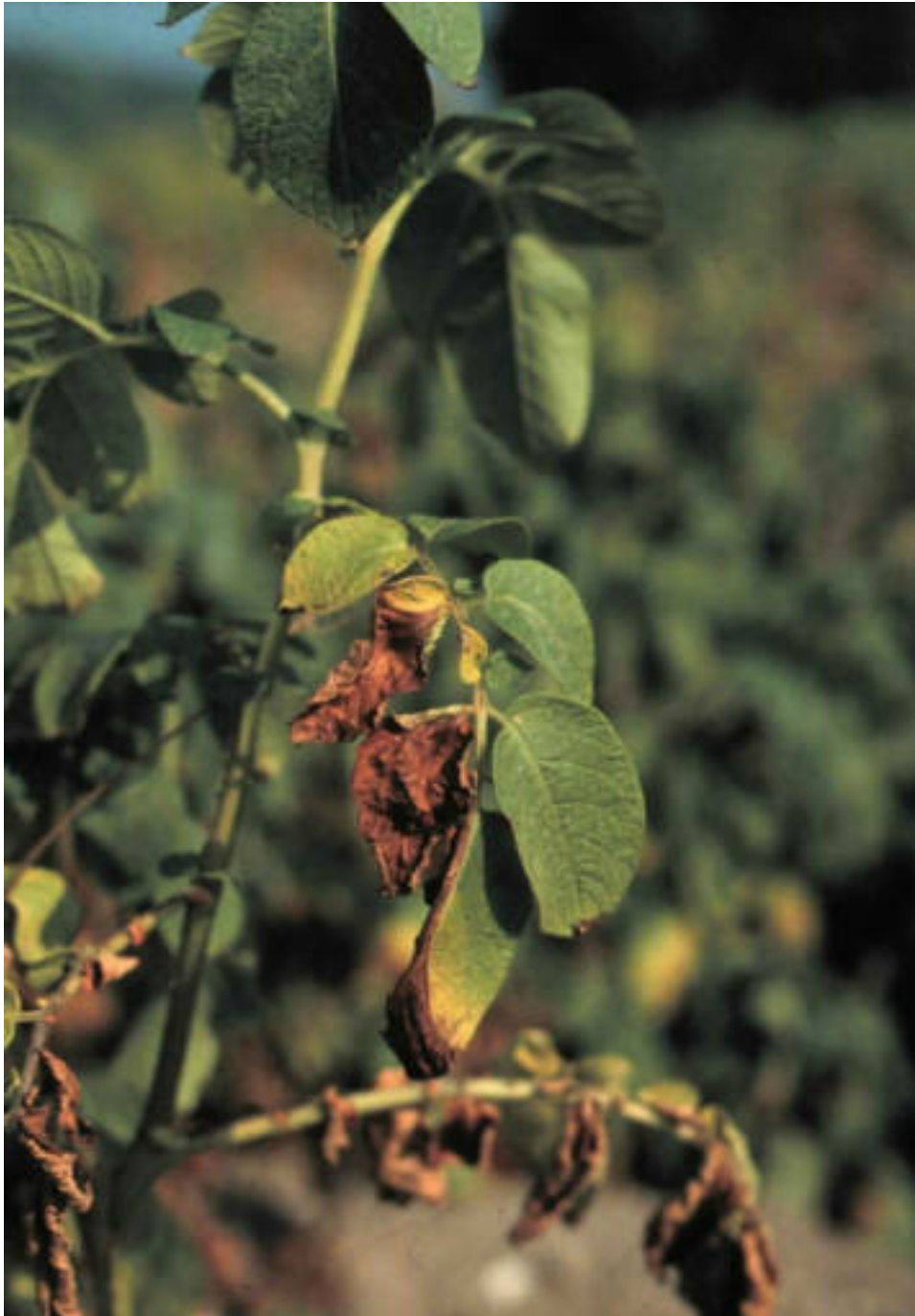
Halfzijdige verwelking en afsterving van aardappelbladeren door Verticillium dahliae .