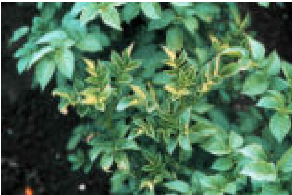
Plant met geknepen blaadjes door watergebrek agv Rhizoctonia .