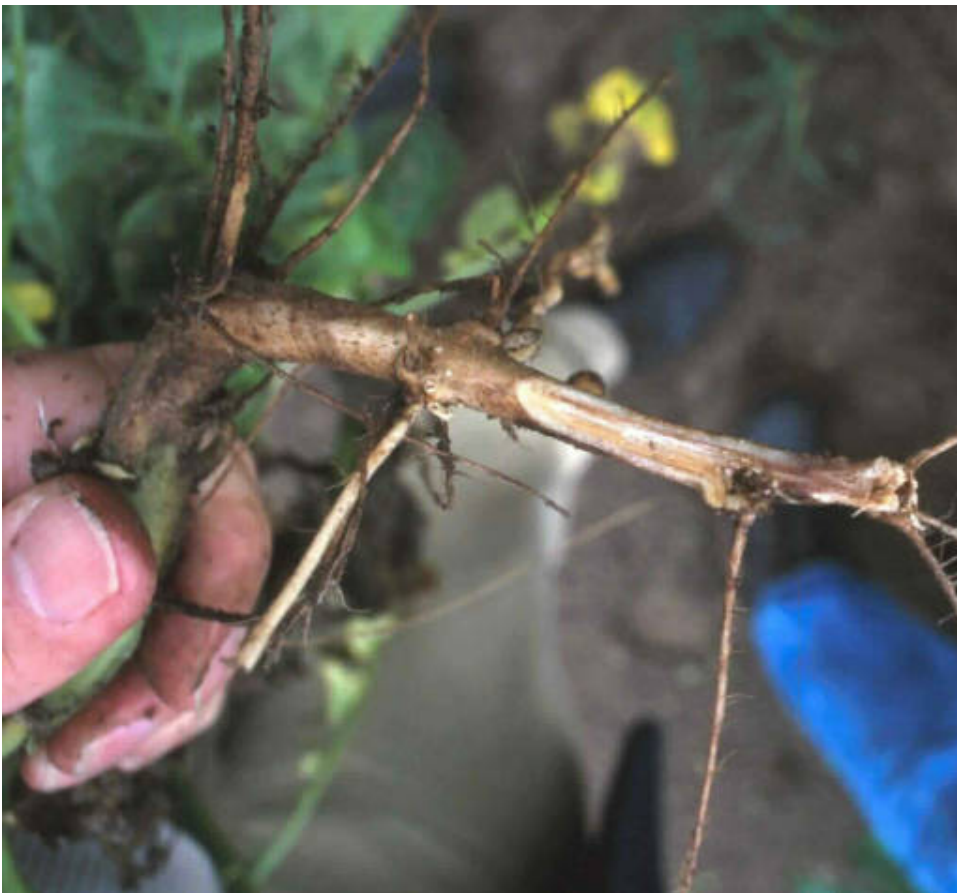
Roze verkleuring van de vaatbundels in de stengel.