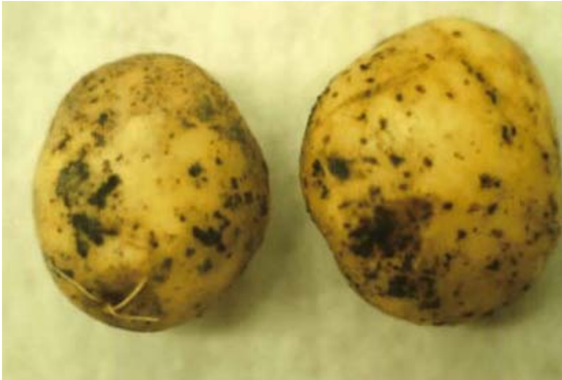
Lakschurft op de aardappelknol.