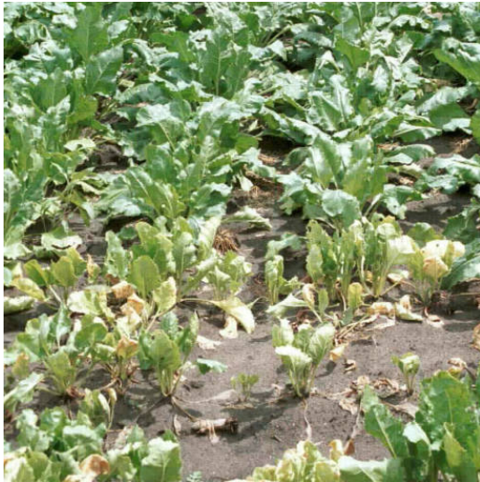
Rhizoctonia plek in suikerbiet.