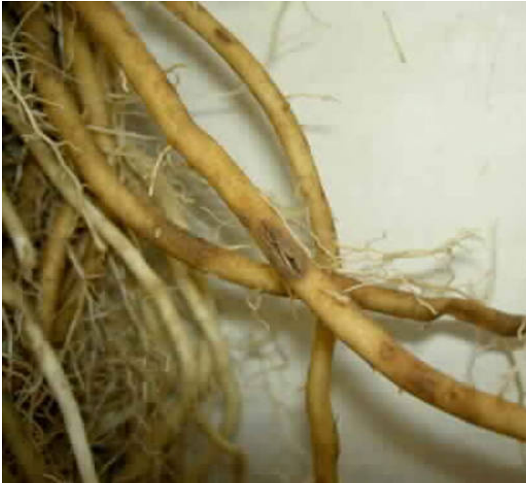
Lesies op jonge en oude aspergewortels als gevolg van Foa.