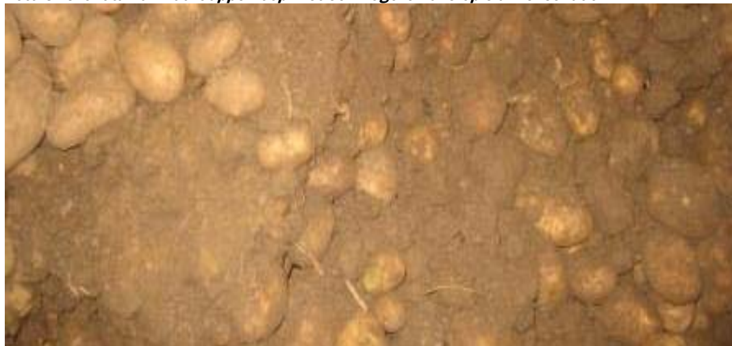
Foto 8. Grondtarra in aardappelhoop met een hogere kans op slakkenschade.

In oktober zijn de meeste aardappelen geoogst. Het type rooier was zeer divers. Het aan- of afwezig zijn van axiaalrollen op de rooimachine had geen duidelijk effect op het voorkomen van schade, de telers zonder problemen gaven echter iets meer het bezit en gebruik van axiaalrollen aan. Onder zowel droge als natte omstandigheden zijn probleem en geen probleem percelen geroid. Alle aardappelen zijn ingeschuurd. Bij twaalf respondenten is weinig tot geen grond geoogst, drie telers met slakkenschade gaven aan dat er meer of veel grond is mee geoogst (foto 8). Bij één teler zonder schade werd wat onbekende schade waargenomen. Van de negen telers met schade gaven vijf aan dat ze de oorzaak van schade niet konden vaststellen.