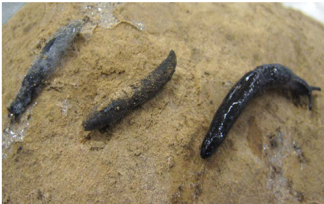
Foto 9. Dode slak in ontbinding (links), net gestorven slak die indroogt (midden) en een nog levende slak (rechts) in een partij aardappelen op 8 december 2009, ca. 8 week na de oogst.

Slakken worden vaak vlak na het inschuren gezien, daarna zijn het de slijmsporen die nog getuigen van slakkenactiviteit (Foto 10). In de bewaring lijkt de schade nauwelijks toe te nemen, tenzij de partij veel tarra bevat. De partij is dan minder goed te ventileren en te drogen waar de slakken van profiteren. De