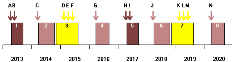
Grafiek 1. Opeenvolging van gewassen en bemesting in de rotatie. 2017-2020 is identiek aan 2013-2016. Gewassen. 1= consumptieaardappel; 2= Suikerbiet; 3= Wintertarwe; 4= Zaaiui. Alle bemestingen met KAS, waarden in kg N. A= 195; B= 80; C= 150; D= 100; E= 100; F= 45; G= 120