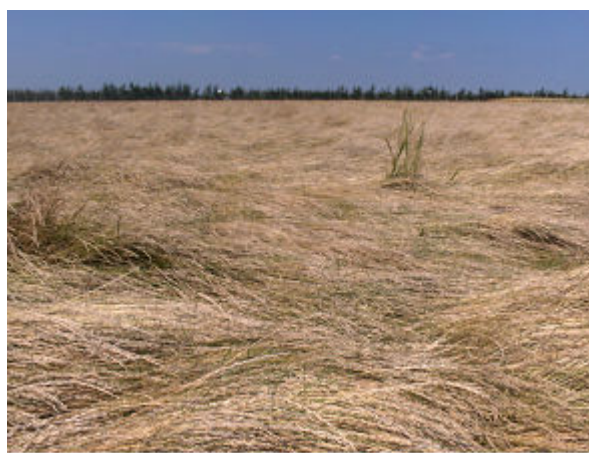
Het ongemaaide gewas op 23 juli 2008 links Elgon, rechts Stravinsky.