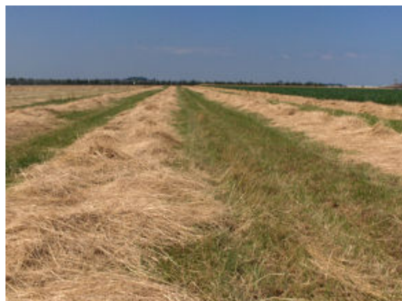
Stamdorsen en gedorsen graszaadstro.