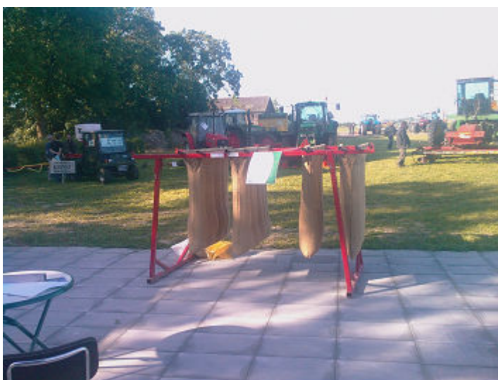
Het Joppe-systeem in het klein.