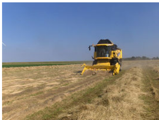
In het zwad (links) en zwaddorsen (rechts).